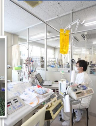
呼吸器装着患者への ベッドサイド透析