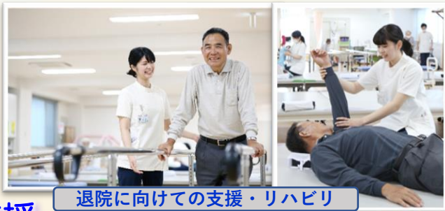
退院に向けての支援・リハビリ